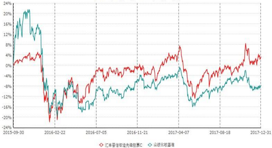
汇丰晋信智造先锋股票C累计净值增长率与业绩比较基准收益率历史走势对比图 (2015年09月30日-2017年12月31日)