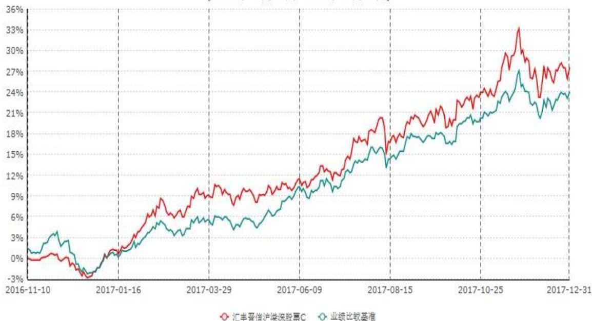
汇丰晋信沪港深股票C累计净值增长率与业绩比较基准收益率历史走势对比图 (2016年11月10日-2017年12月31日)

注：1. 按照基金合同的约定，本基金的投资组合比例为：基金的投资组合比例为：股票资产占基金资产的 80%–95%（投资于港股通标的股票的比例占基金资产的 0–95%），投资于权证的比例为基金资产净值的 0–3%，现金或者到期日在一年以内的政府债券不低于基金资产净值 5%。本基金依据法律法规的规定，本着谨慎和风险可控的原则，可参与创业板上市证券的投资。