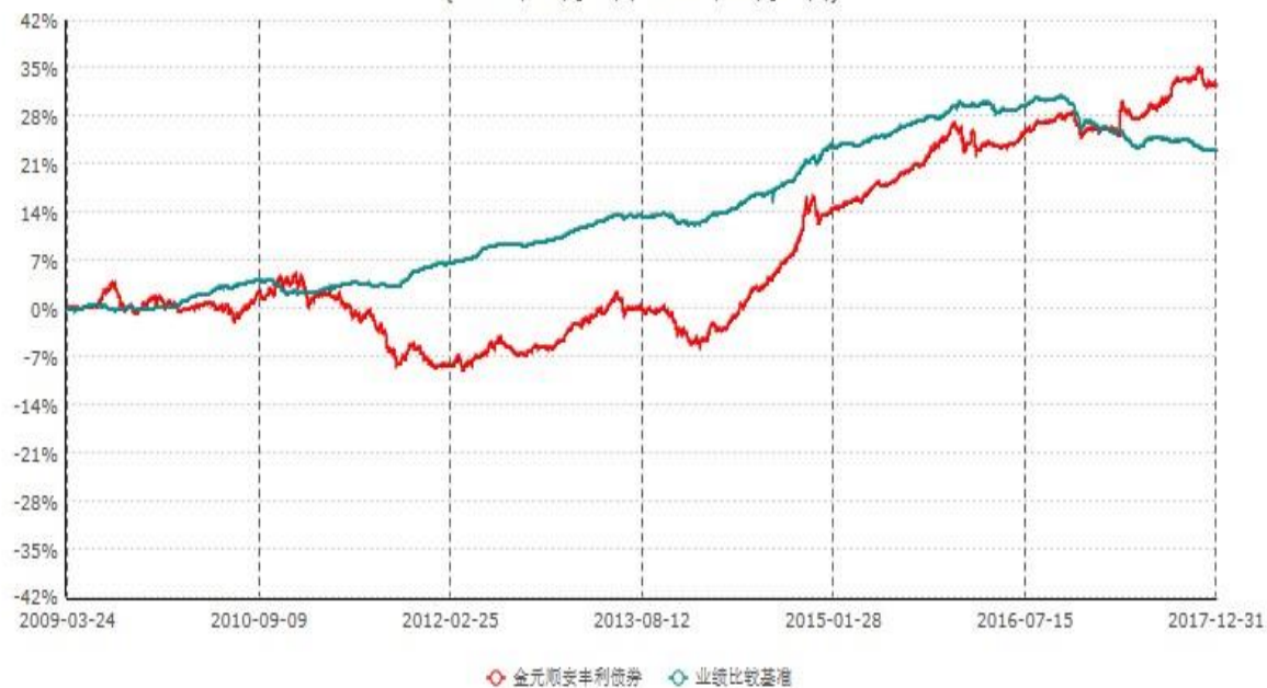
金元顺安丰利债券型证券投资基金累计净值增长率与业绩比较基准收益率历史走势对比图 (2009年03月23日-2017年12月31日)