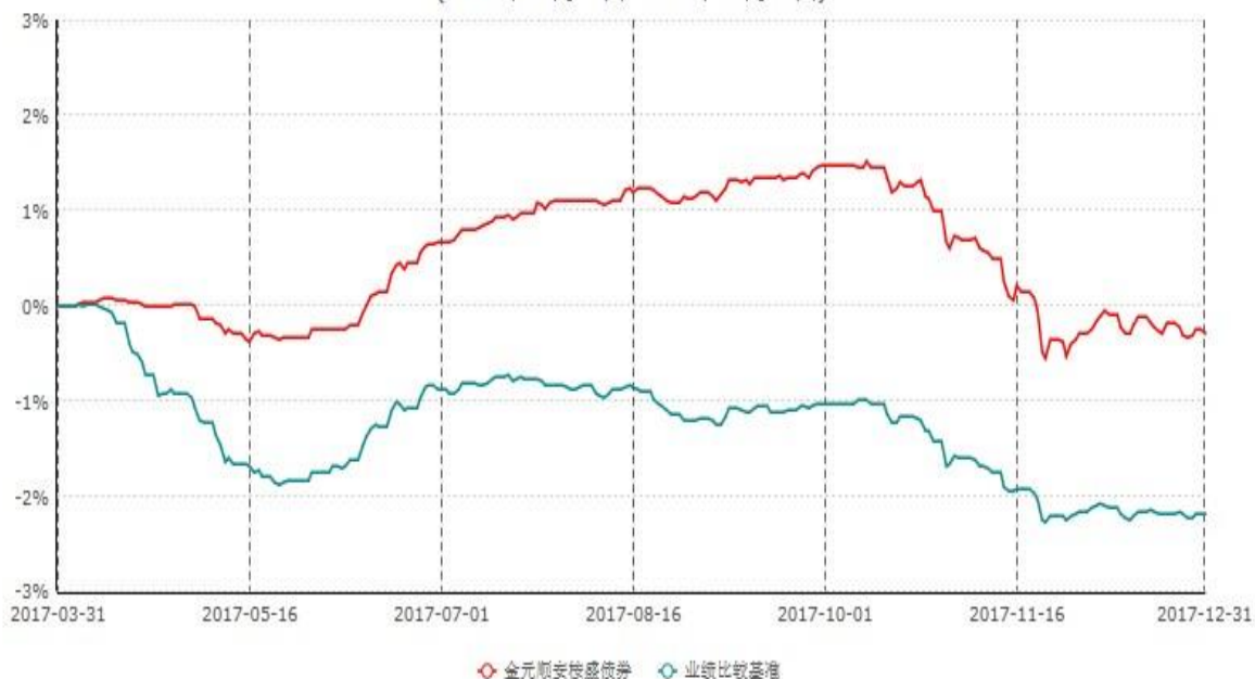
金元顺安桉盛债券型证券投资基金累计净值增长率与业绩比较基准收益率历史走势对比图 (2017年03月30日-2017年12月31日)