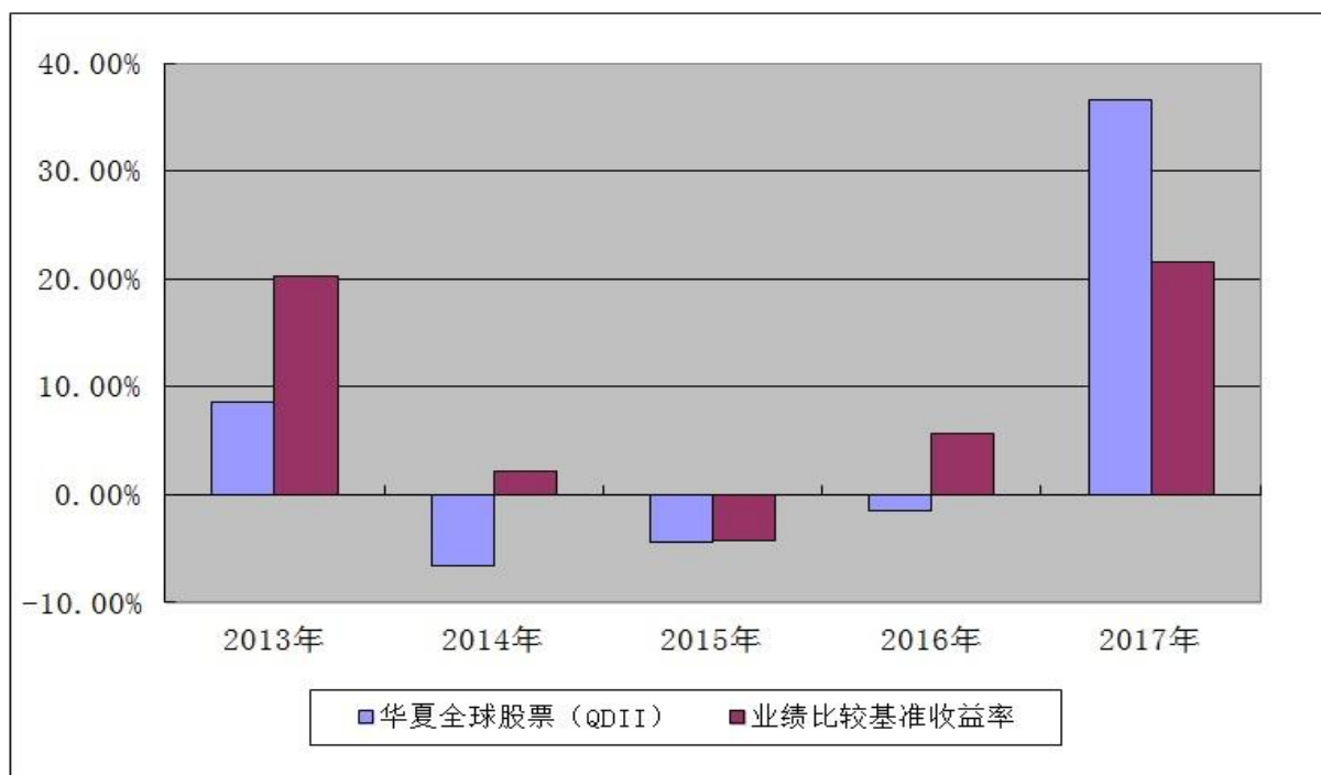
华夏全球精选股票型证券投资基金 基金每年净值增长率及其与同期业绩比较基准收益率的对比图