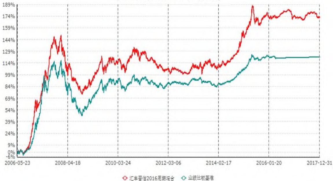
汇丰晋信2016生命周期开放式证券投资基金累计净值增长率与业绩比较基准收益率历史走势对比图 (2006年05月23日-2017年12月31日)