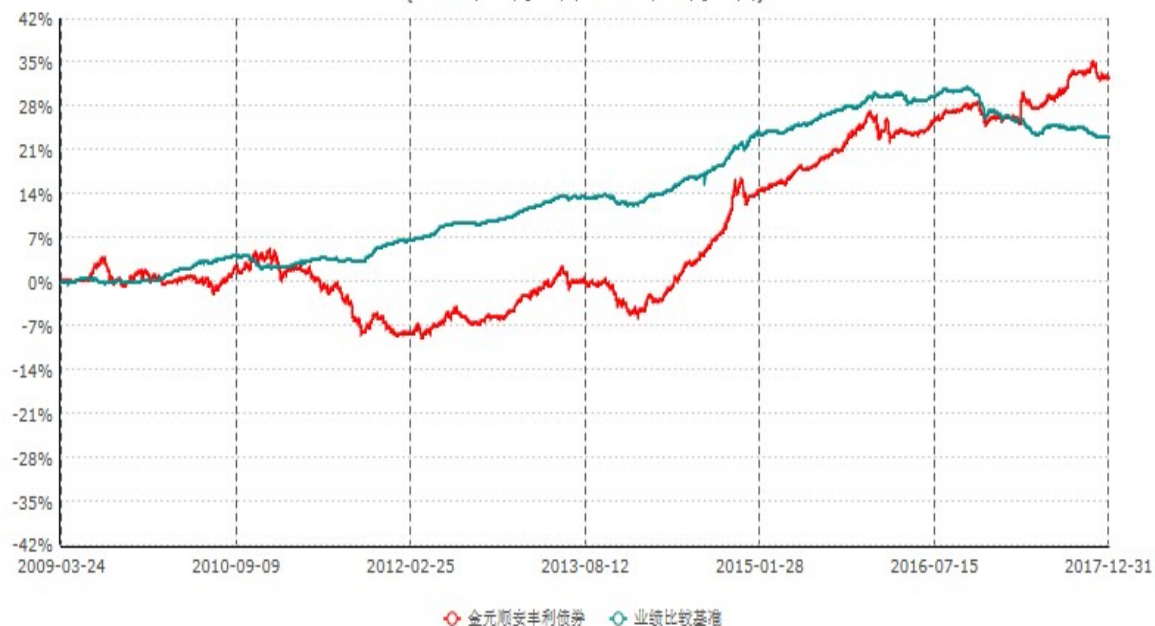
金元顺安丰利债券型证券投资基金累计净值增长率与业绩比较基准收益率历史走势对比图 (2009年03月23日-2017年12月31日)