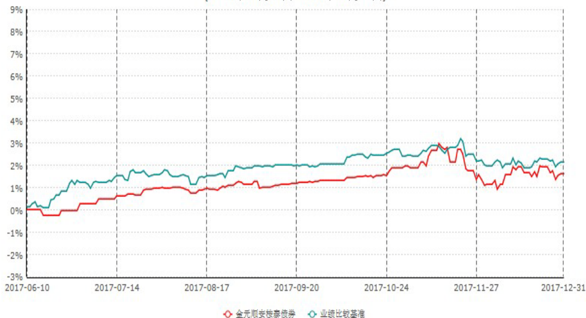
金元顺安桉泰债券型证券投资基金累计净值增长率与业绩比较基准收益率历史走势对比图 (2017年06月09日-2017年12月31日)