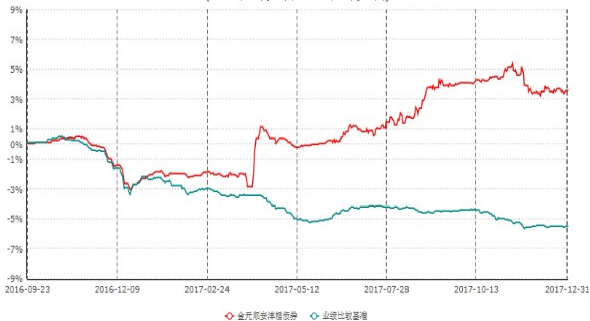
金元顺安沅楹债券型证券投资基金累计净值增长率与业绩比较基准收益率历史走势对比图 (2016年09月22日-2017年12月31日)