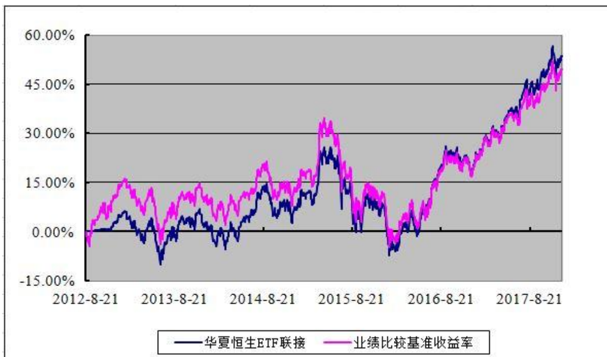
恒生交易型开放式指数证券投资基金联接基金 份额累计净值增长率与业绩比较基准收益率历史走势对比图 (2012 年 8 月 21 日至 2017 年 12 月 31 日)