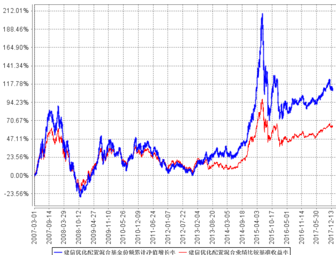
建信优化配置混合基金份额累计净值增长率与同期业绩比较基准收益率的历史走势对比图