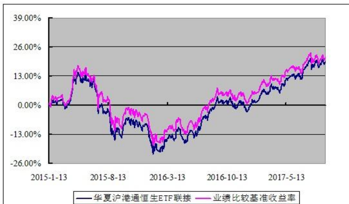
华夏沪港通恒生交易型开放式指数证券投资基金联接基金 份额累计净值增长率与业绩比较基准收益率历史走势对比图 (2015 年 1 月 13 日至 2017 年 12 月 31 日)