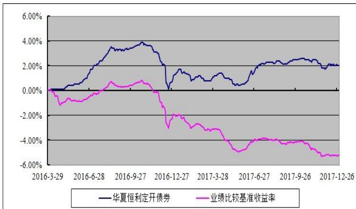
华夏恒利 6 个月定期开放债券型证券投资基金 份额累计净值增长率与业绩比较基准收益率的历史走势对比图 (2016 年 3 月 29 日至 2017 年 12 月 31 日)