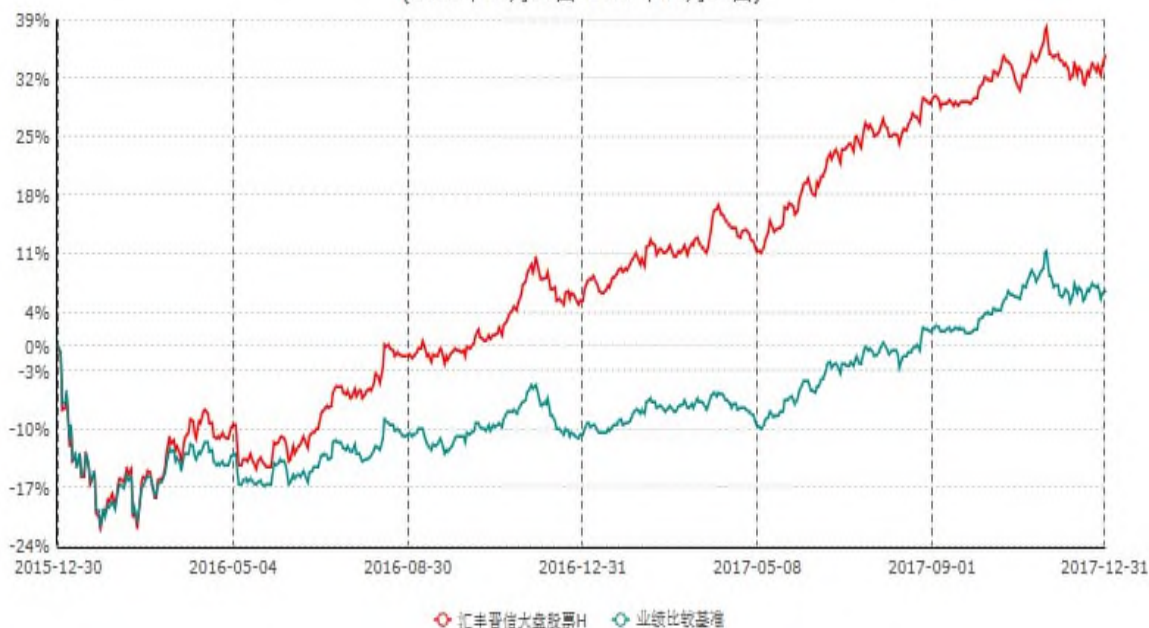
汇丰晋信大盘股票H累计净值增长率与业绩比较基准收益率历史走势对比图 (2015年12月30日-2017年12月31日)