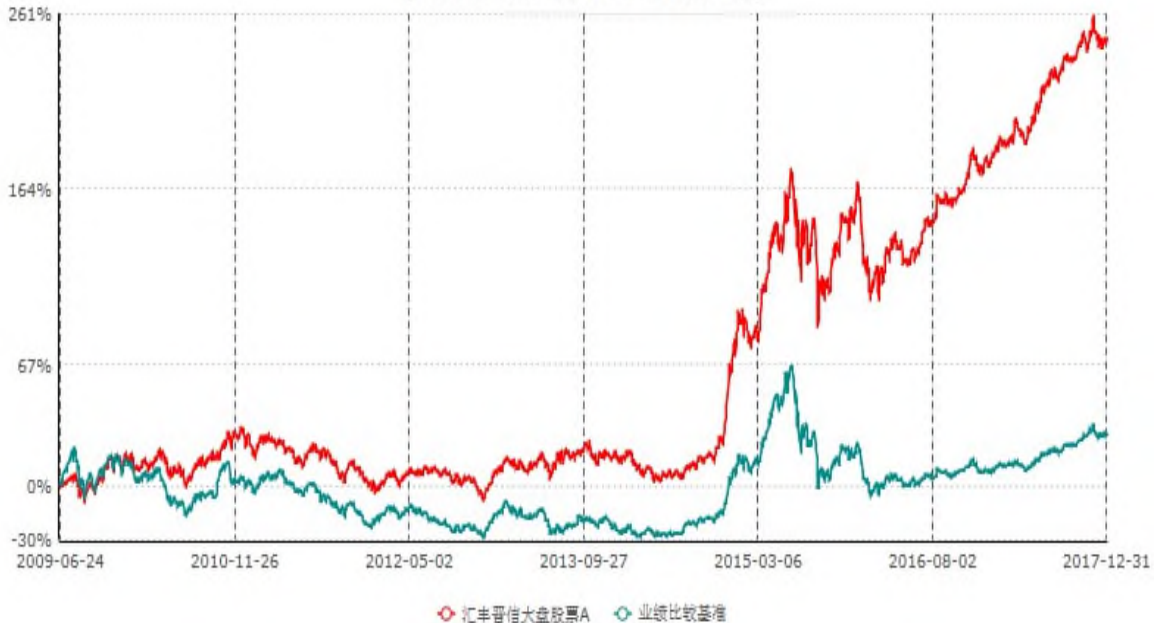
汇丰晋信大盘股票A累计净值增长率与业绩比较基准收益率历史走势对比图 (2009年06月24日-2017年12月31日)