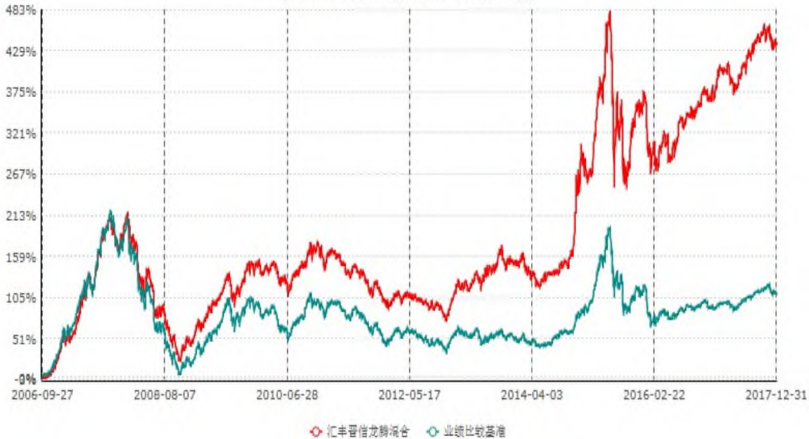
汇丰晋信龙腾混合型证券投资基金累计净值增长率与业绩比较基准收益率历史走势对比图 (2006年09月27日-2017年12月31日)

注：1. 按照基金合同的约定，本基金的投资组合比例为：股票占基金资产的60%–95%；除股票以外的其他资产占基金资产的5%–40%，其中现金或到期日在一年期以内的国债的比例合计不低于基金资产净值的5%。本基金自基金合同生效日起不超过6个月内完成建仓。截止2007年3月27日，本基金的各项投资比例已达到基金合同约定的比例。