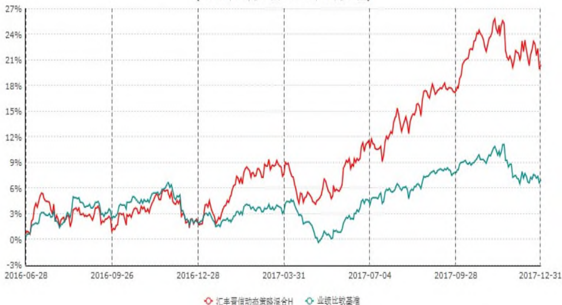
汇丰晋信动态策略混合H累计净值增长率与业绩比较基准收益率历史走势对比图 (2016年06月28日-2017年12月31日)