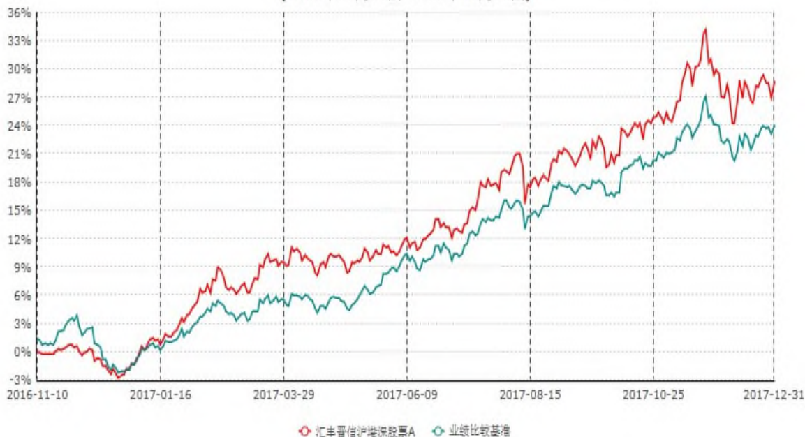
汇丰晋信沪港深股票A累计净值增长率与业绩比较基准收益率历史走势对比图 (2016年11月10日-2017年12月31日)

注：1. 按照基金合同的约定，本基金的投资组合比例为：基金的投资组合比例为：股票资产占基金资产的 80%–95%（投资于港股通标的股票的比例占基金资产的 0–95%），投资于权证的比例为基金资产净值的 0–3%，现金或者到期日在一年以内的政府债券不低于基金资产净值 5%。本基金依据法律法规的规定，本着谨慎和风险可控的原则，可参与创业板上市证券的投资。