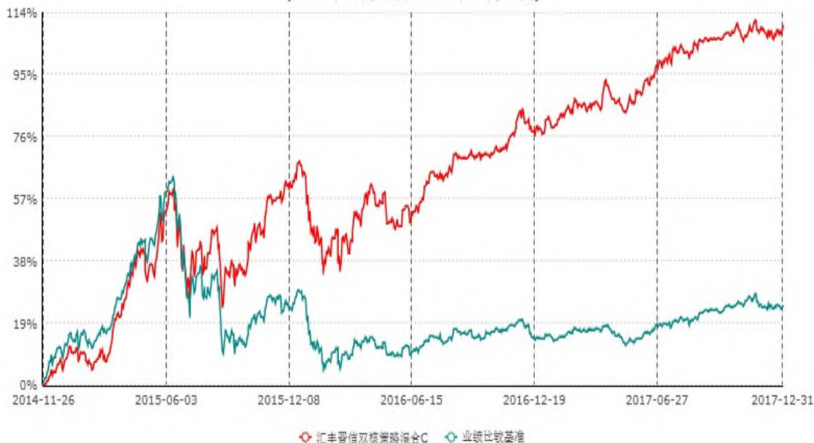
汇丰晋信双核策略混合C累计净值增长率与业绩比较基准收益率历史走势对比图 (2014年11月26日-2017年12月31日)