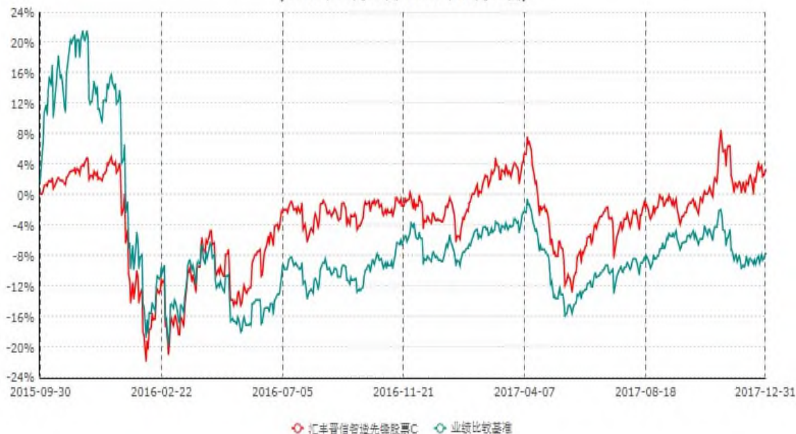
汇丰晋信智造先锋股票C累计净值增长率与业绩比较基准收益率历史走势对比图 (2015年09月30日-2017年12月31日)