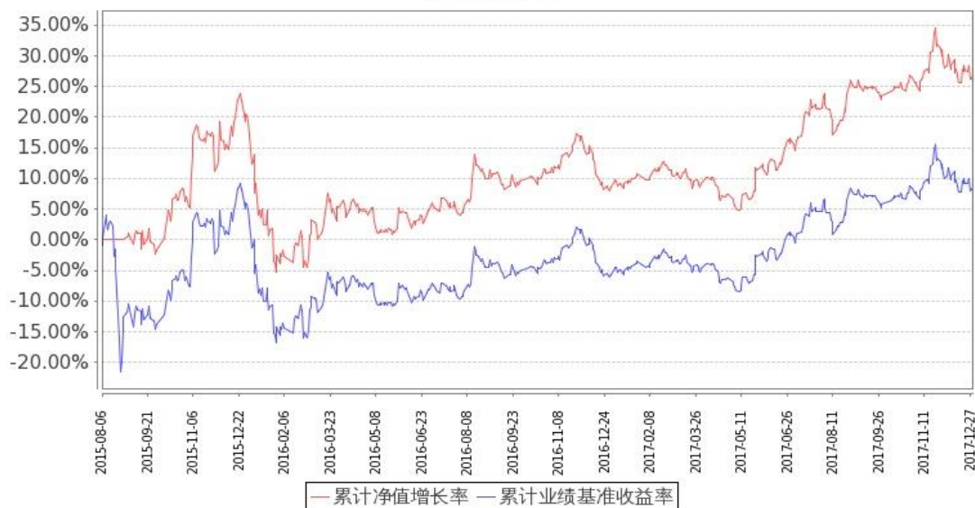
图：嘉实中证金融地产 ETF 联接基金份额累计净值增长率与同期业绩比较基准收益率的历史走势对比图