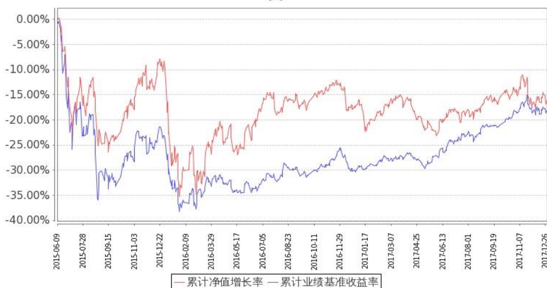
图：嘉实事件驱动股票基金份额累计净值增长率与同期业绩比较基准收益率的历史走势对比图