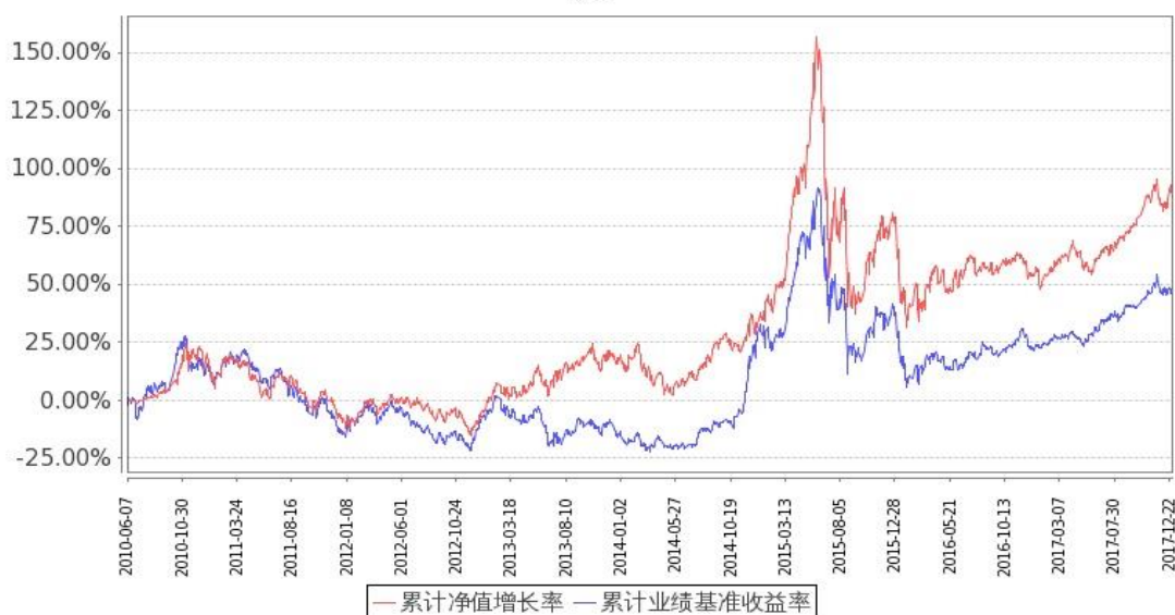
图：嘉实价值优势混合基金份额累计净值增长率与同期业绩比较基准收益率的历史走势对比图