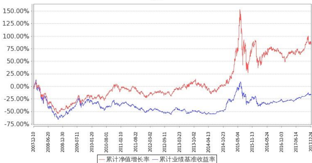
图：嘉实优质企业混合基金累计份额净值增长率与同期业绩比较基准收益率的历史走势对比图