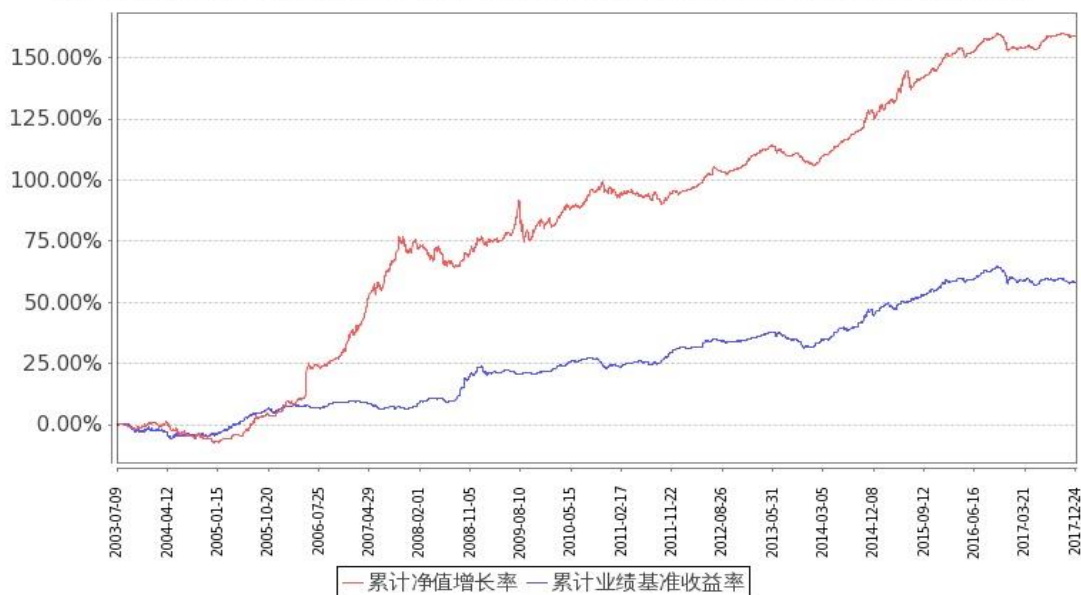
图：嘉实债券份额累计净值增长率与同期业绩比较基准收益率的历史走势对比图