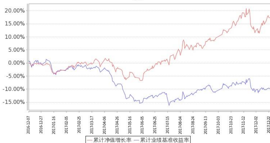
图：嘉实农业产业股票基金份额累计净值增长率与同期业绩比较基准收益率的历史走势对比图 (2016年12月7日至2017年12月31日)

注：按基金合同和招募说明书的约定，本基金自基金合同生效日起6个月内为建仓期，建仓期结束时本基金的各项投资比例符合基金合同（十二（二）投资范围和（四）投资限制）的有关约定。