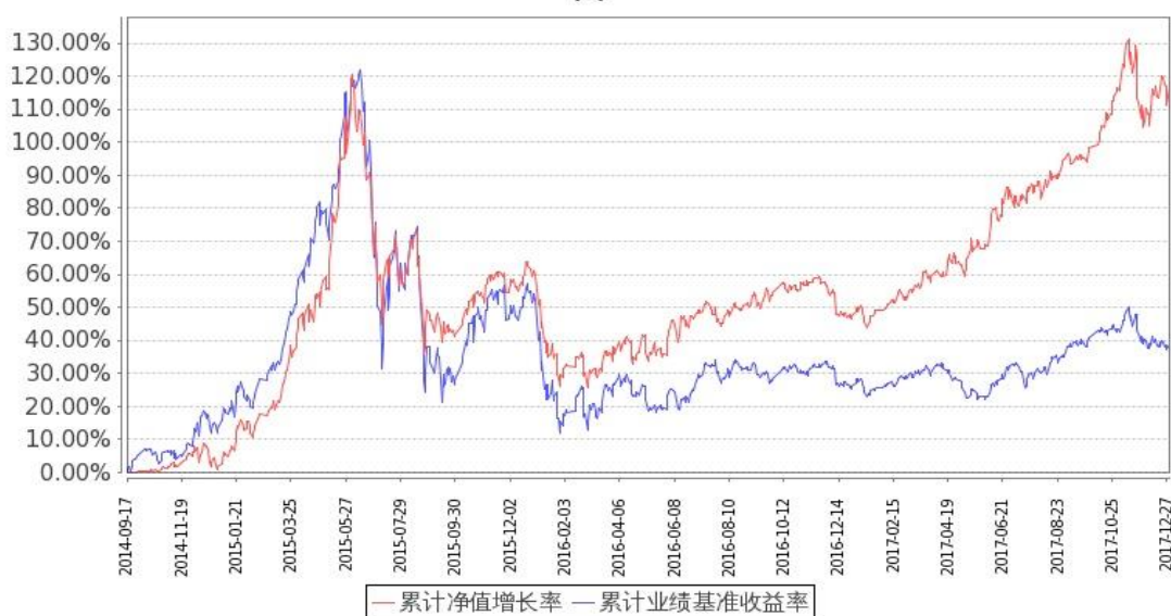
图：嘉实新兴产业股票型证券投资基金份额累计净值增长率与同期业绩比较基准收益率的历史走势对比图