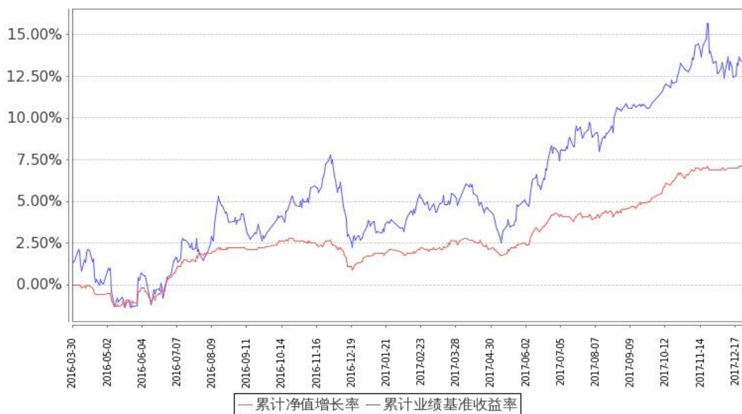
图 2：嘉实新常态混合 C 基金份额累计净值增长率与同期业绩比较基准收益率的历史走势对比图 (2016 年 3 月 30 日至 2017 年 12 月 31 日)

注：按基金合同和招募说明书的约定，本基金自基金合同生效日起 6 个月内为建仓期，建仓期结束时本基金的各项投资比例符合基金合同（十二（二）投资范围和（四）投资限制）的有关约定。