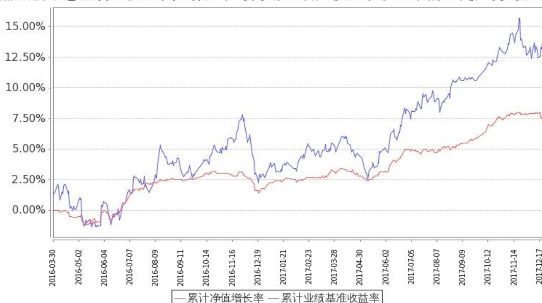
嘉实新常态混合A累计净值增长率与同期业绩比较基准收益率的历史走势对比图