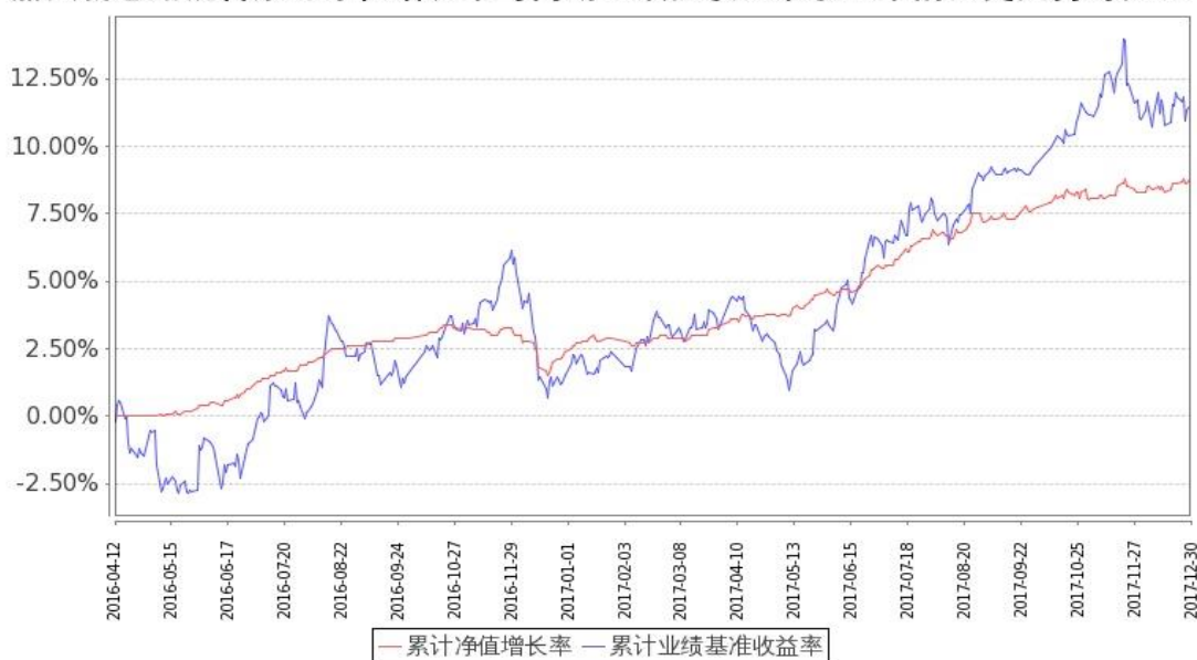
图：嘉实新思路混合基金份额累计净值增长率与同期业绩比较基准收益率的历史走势对比图