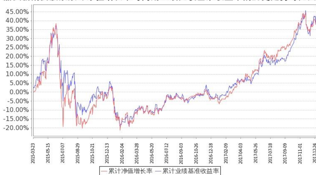
图：嘉实新消费股票基金份额累计净值增长率与同期业绩比较基准收益率的历史走势对比图 (2015年3月23日至2017年12月31日)

注：1. 按基金合同和招募说明书的约定，本基金自基金合同生效日起6个月内为建仓期，建仓期结束时本基金的各项投资比例符合基金合同（十二（二）投资范围和（四）投资限制）的有关约定。