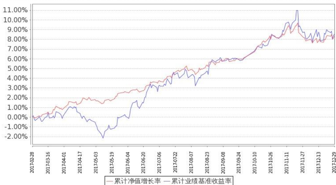
图：嘉实新添程混合基金份额累计净值增长率与同期业绩比较基准收益率的历史走势对比图 (2017年2月28日至2017年12月31日)

注：本基金基金合同生效日2017年2月28日至报告期末未满足1年。按基金合同和招募说明书的约定，本基金自基金合同生效日起6个月内为建仓期，建仓期结束时本基金的各项投资比例符合基金合同（十二（二）投资范围和（四）投资限制）的有关约定。