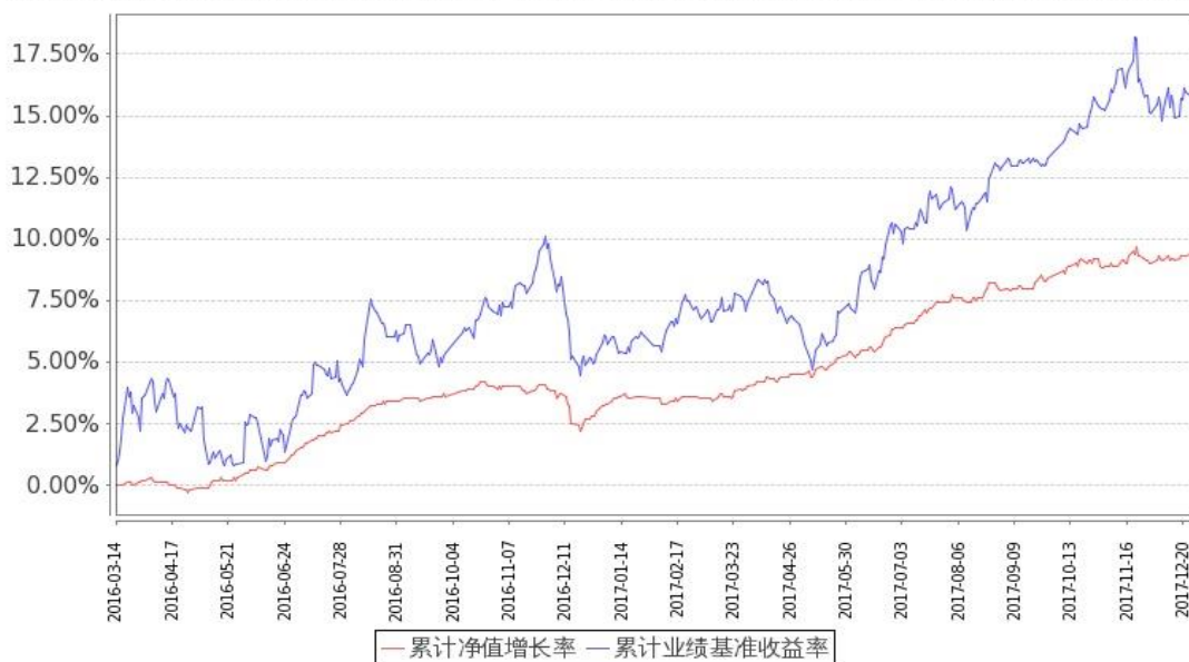
图：嘉实新财富混合基金份额累计净值增长率与同期业绩比较基准收益率的历史走势对比图