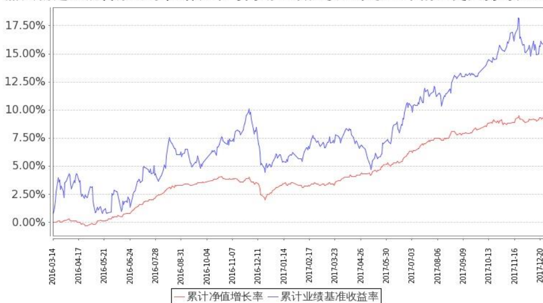
图：嘉实新起航混合基金份额累计净值增长率与同期业绩比较基准收益率的历史走势对比图