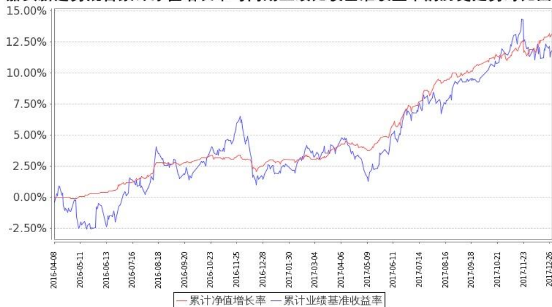
图：嘉实新趋势混合基金份额累计净值增长率与同期业绩比较基准收益率的历史走势对比图