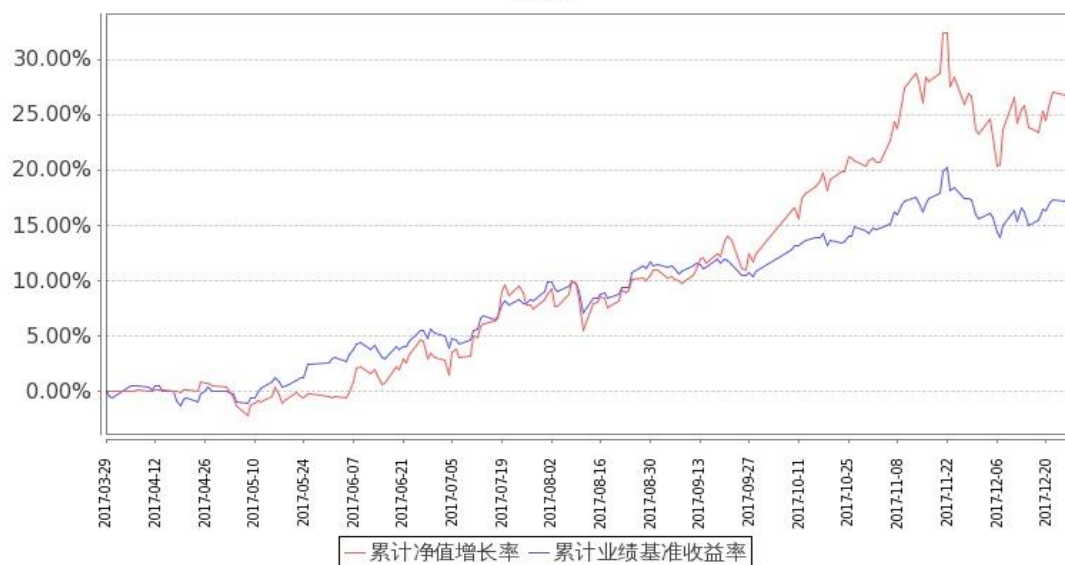
图：嘉实沪港深回报混合基金份额累计净值增长率与同期业绩比较基准收益率的历史走势对比图 (2017年3月29日至2017年12月31日)

注：1. 本基金基金合同生效日 2017 年 3 月 29 日至报告期末未满 1 年。按基金合同和招募说明书的约定，本基金自基金合同生效日起 6 个月内为建仓期，建仓期结束时本基金的各项投资比例符合基金合同（十二（二）投资范围和（四）投资限制）的有关约定。