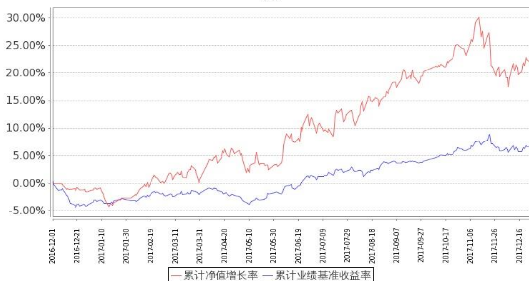
图：嘉实研究增强混合基金份额累计净值增长率与同期业绩比较基准收益率的历史走势对比图 (2016 年 12 月 1 日至 2017 年 12 月 31 日)

注：按基金合同和招募说明书的约定，本基金自基金合同生效日起 6 个月内为建仓期，建仓期结束时本基金的各项投资比例符合基金合同（十二（二）投资范围和（四）投资限制）的有关约定。