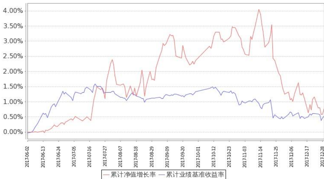
图 1：嘉实稳宏债券 A 基金份额累计净值增长率与同期业绩比较基准收益率的历史走势对比图