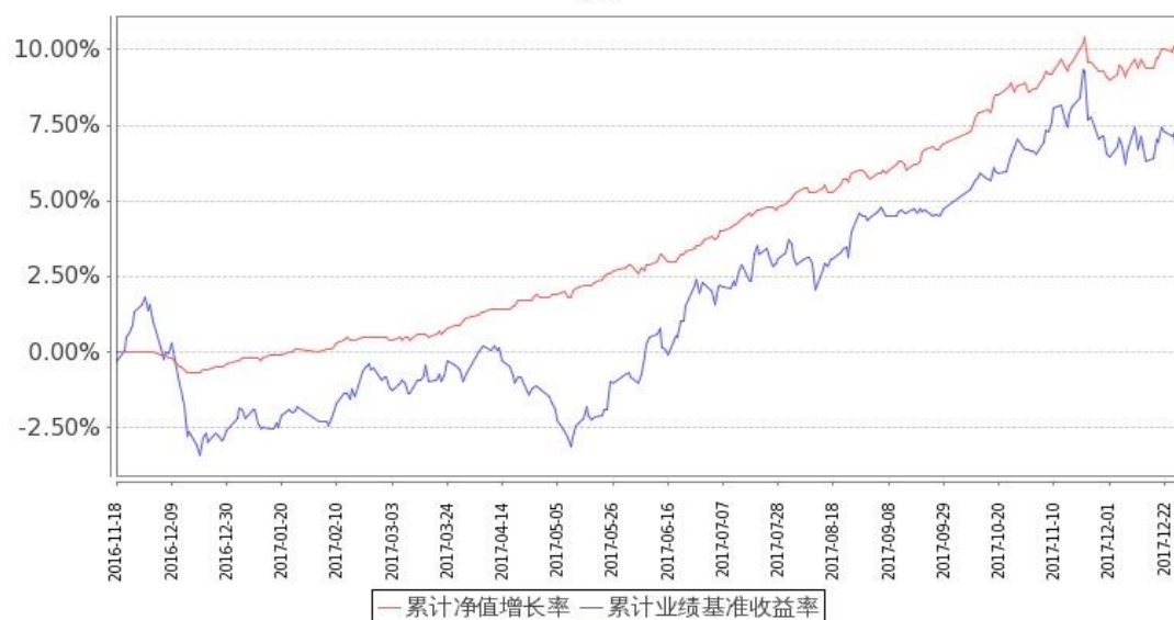
图：嘉实策略优选混合基金份额累计净值增长率与同期业绩比较基准收益率的历史走势对比图 (2016 年 11 月 18 日至 2017 年 12 月 31 日)

注：(1) 按基金合同和招募说明书的约定，本基金自基金合同生效日起 6 个月内为建仓期，建仓期结束时本基金的各项投资比例符合基金合同（十二（二）投资范围和（四）投资限制）的有关约定。