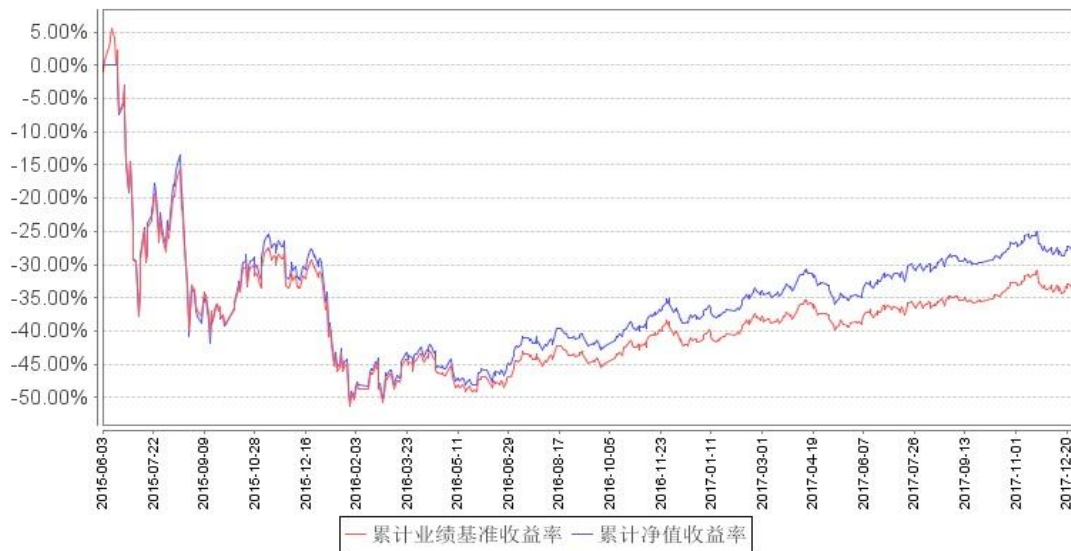
南方中证国有企业改革指数分级累计净值增长率与同期业绩比较基准收益率的历史走势对比图