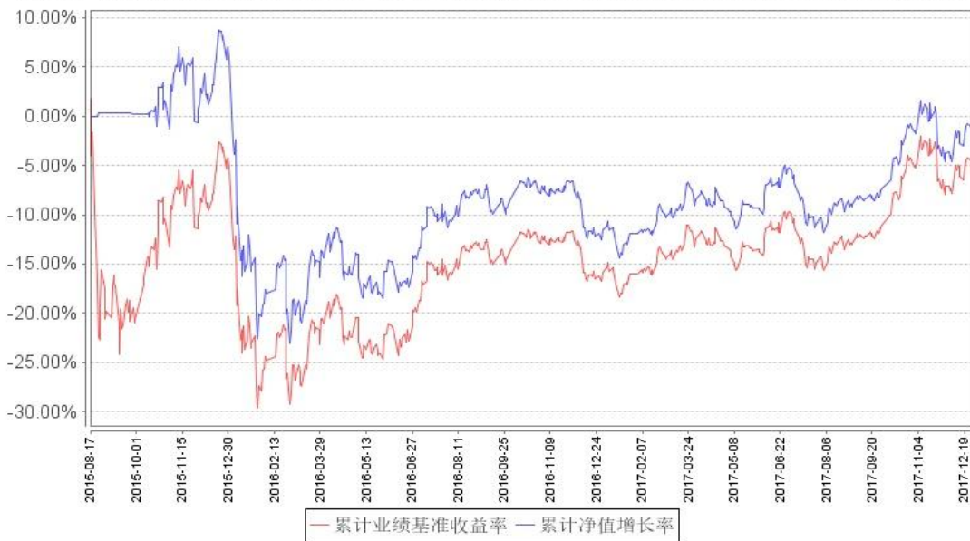
鹏华中证医药卫生累计净值增长率与同期业绩比较基准收益率的历史走势对比图