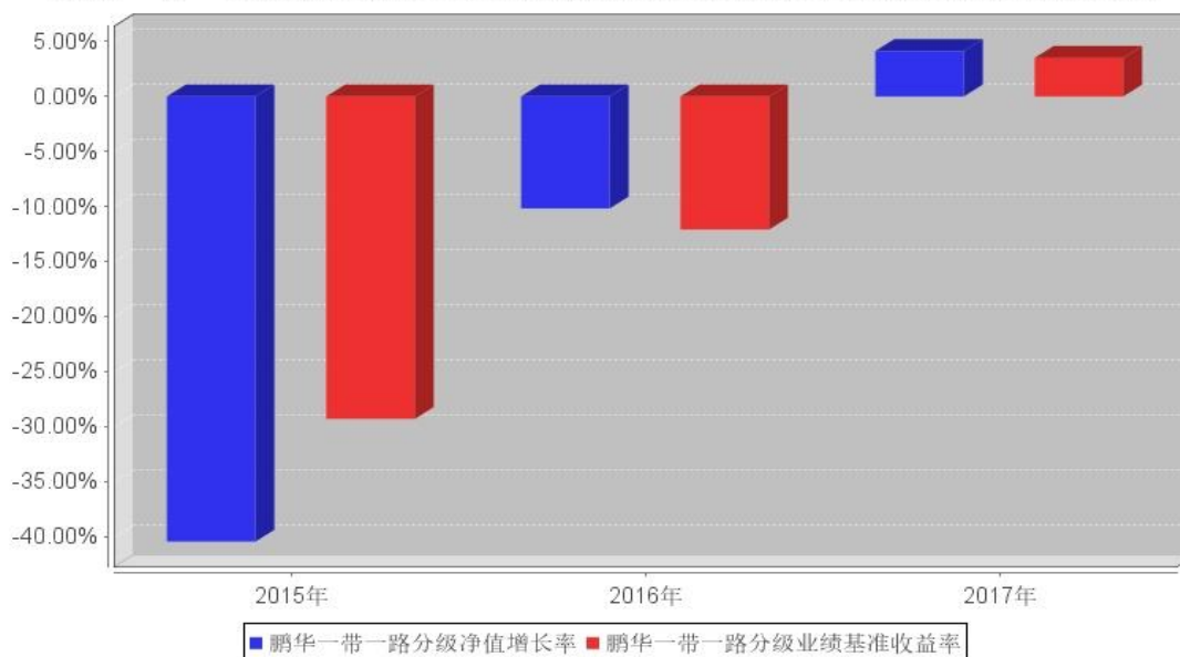
鹏华一带一路分级基金每年净值增长率与同期业绩比较基准收益率的对比图