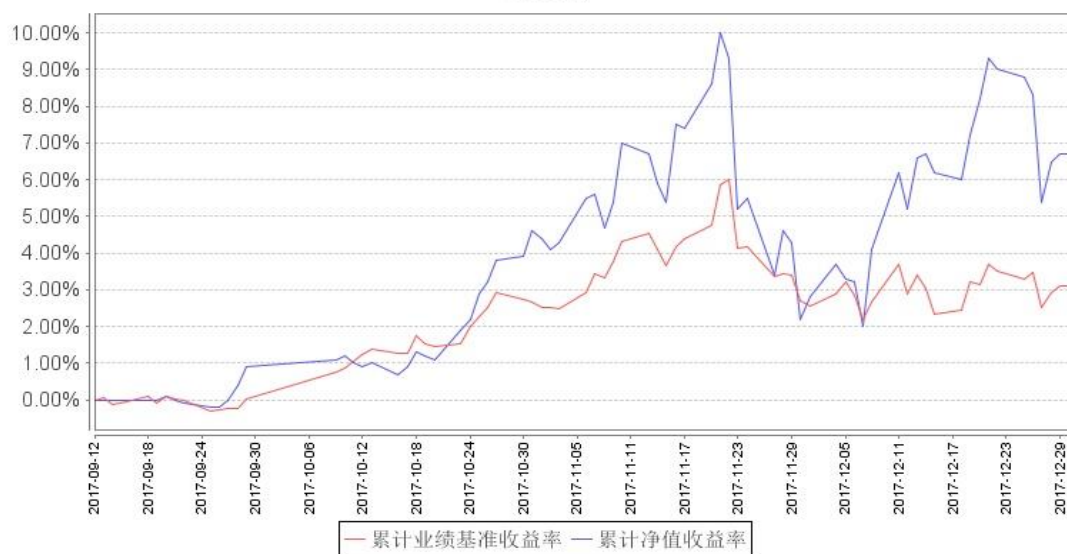
南方兴盛先锋灵活配置混合累计净值增长率与同期业绩比较基准收益率的历史走势对比图

注：基金合同生效日至本报告期末不满一年。本基金建仓期为自基金合同生效之日起 6 个月，截止至本报告期末，建仓期尚未结束。