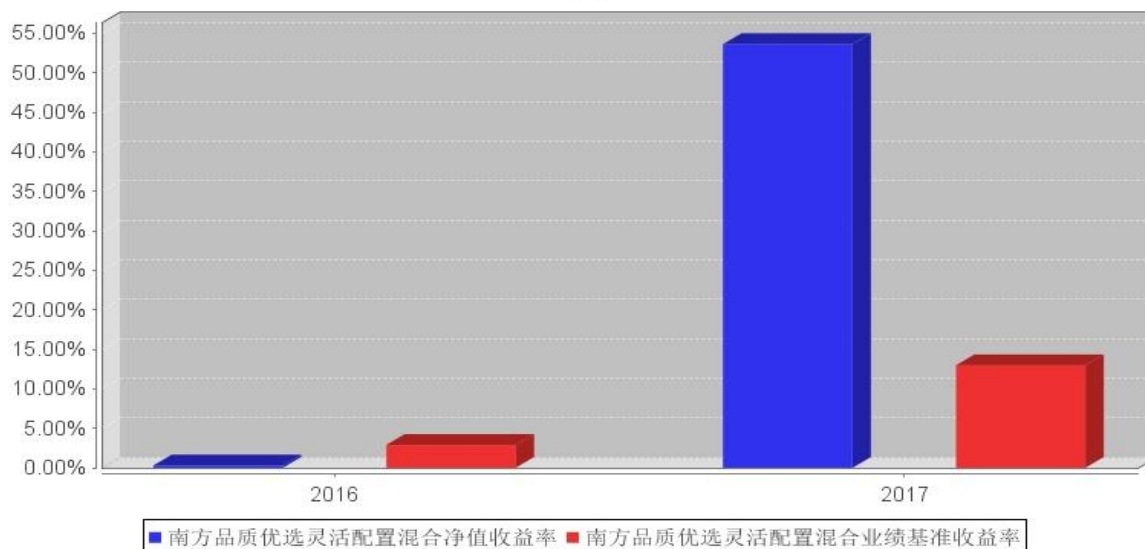
南方品质优选灵活配置混合基金每年净值增长率与同期业绩比较基准收益率的对比图