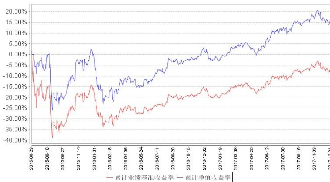
大数据300A级累计净值增长率与同期业绩比较基准收益率的历史走势对比图