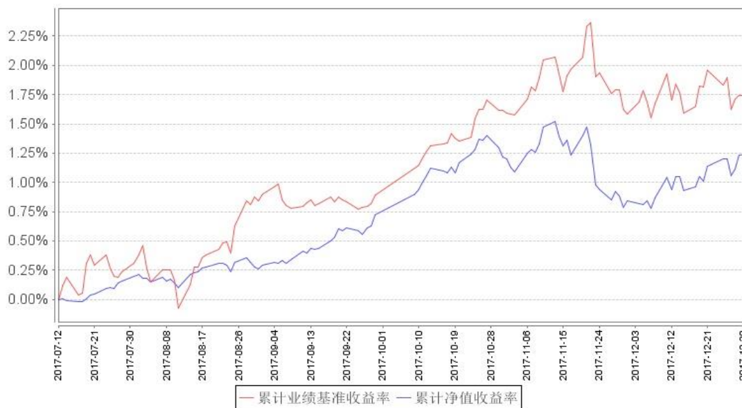
南方安睿混合累计净值增长率与同期业绩比较基准收益率的历史走势对比图

注：本基金的基金合同生效日为 2017 年 7 月 13 日，本基金建仓期为 6 个月，报告期末建仓期尚未结束。