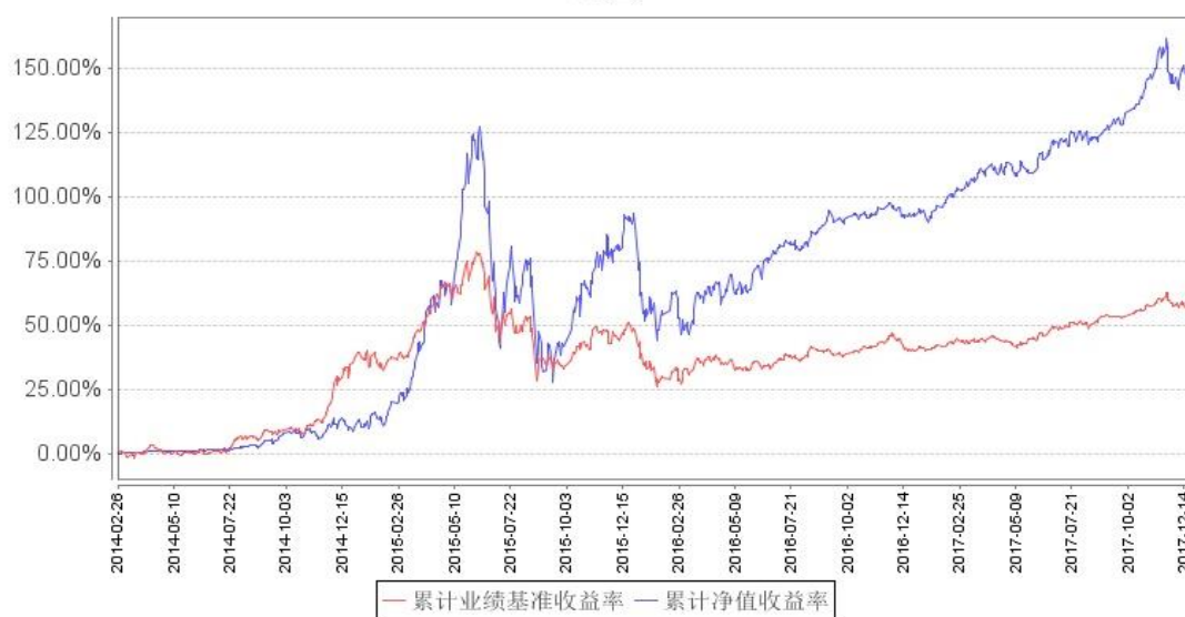
南方新优享灵活配置混合累计净值增长率与同期业绩比较基准收益率的历史走势对比图