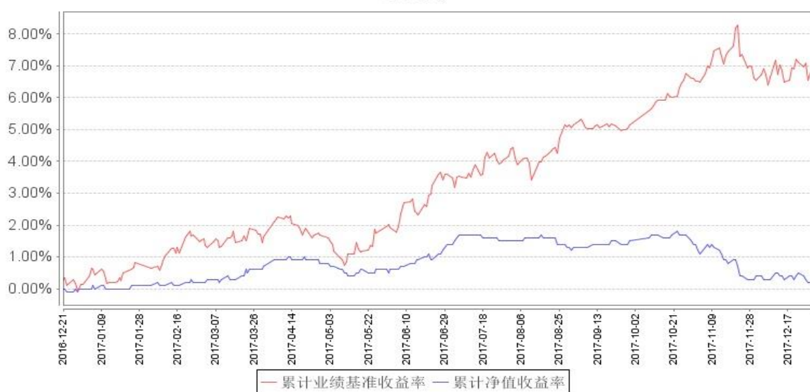
南方睿见定期开放混合发起累计净值增长率与同期业绩比较基准收益率的历史走势对比图

注：本基金建仓期为自基金合同生效之日起 6 个月，建仓结束时各项资产配置比例符合合同约定。