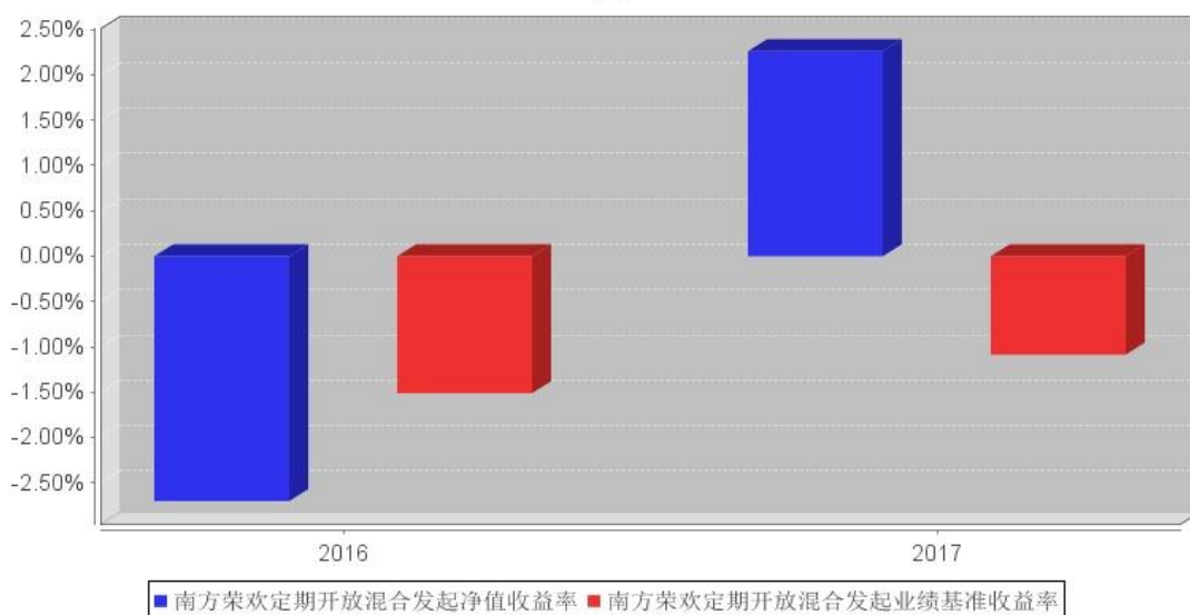
南方荣欢定期开放混合发起基金每年净值增长率与同期业绩比较基准收益率的对比图