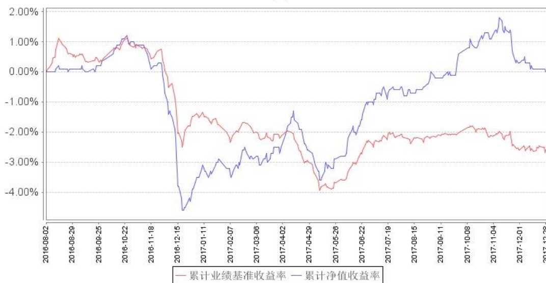
南方荣毅定期开放混合累计净值增长率与同期业绩比较基准收益率的历史走势对比图