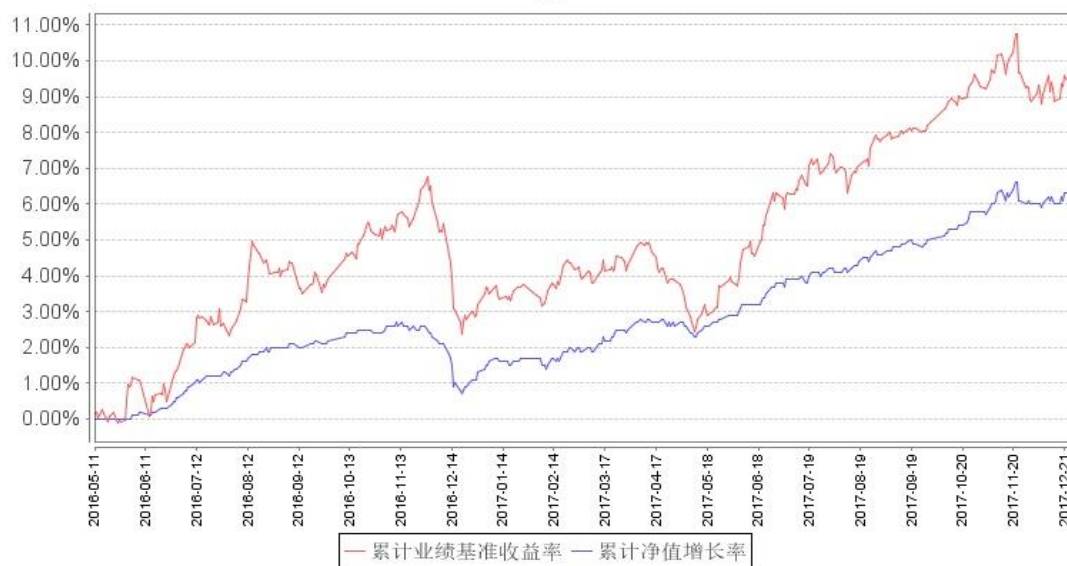
鹏华兴利定期开放混合累计净值增长率与同期业绩比较基准收益率的历史走势对比图