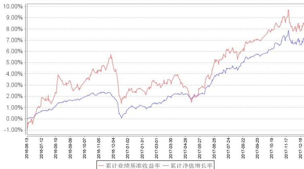
鹏华兴华累计净值增长率与同期业绩比较基准收益率的历史走势对比图

注：1、本基金基金合同于 2016 年 6 月 13 日生效。 2、截至建仓期结束,本基金的各项投资比例已达到基金合同中规定的各项比例。